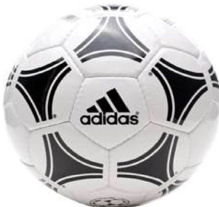
ADIDAS TANGO ROSARIO _ Talla 4 _ con logo FIFA: