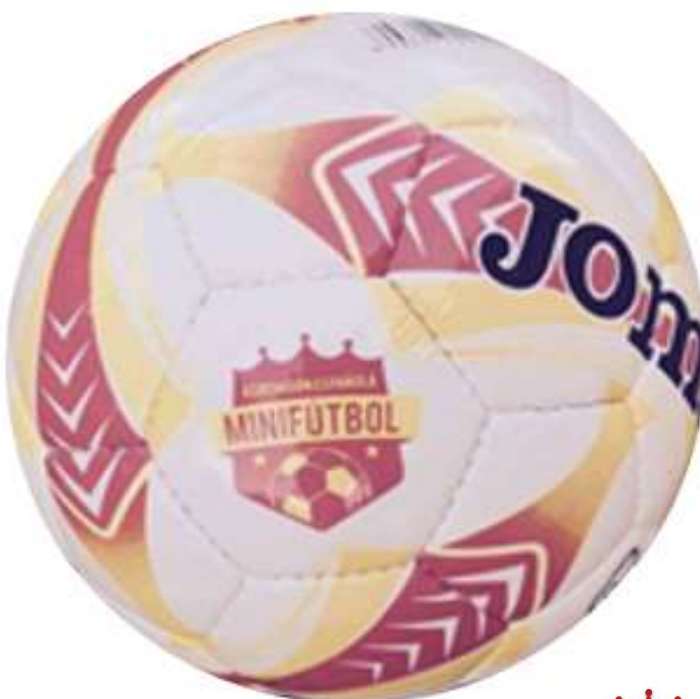
JOMA EGEO 4 con logo AEMF: