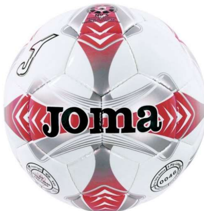
JOMA EGEO 4 sin logo